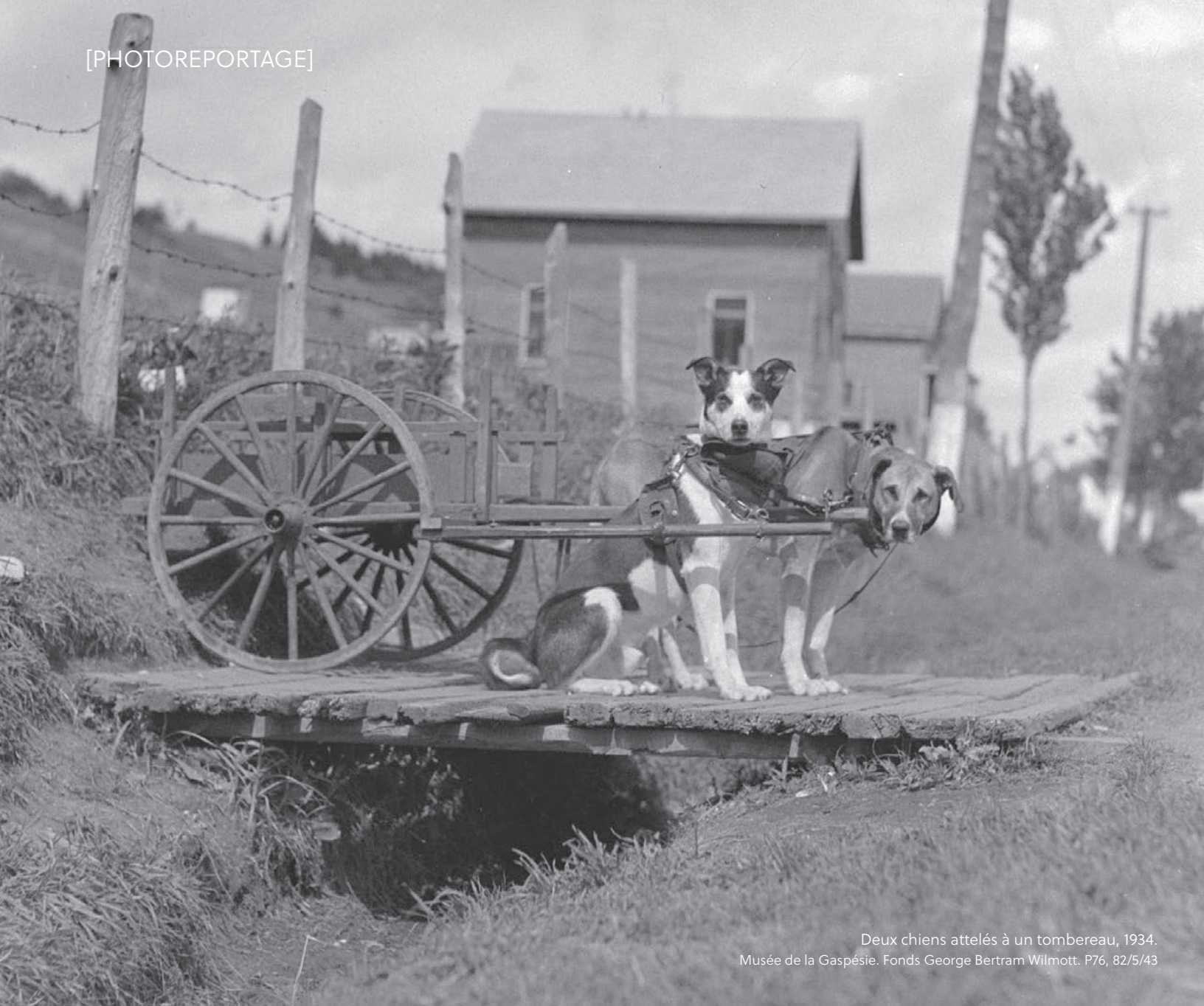
Deux chiens attelés à un tombereau, 1934. Musée de la Gaspésie. Fonds George Bertram Wilmott. P76, 82/5/43