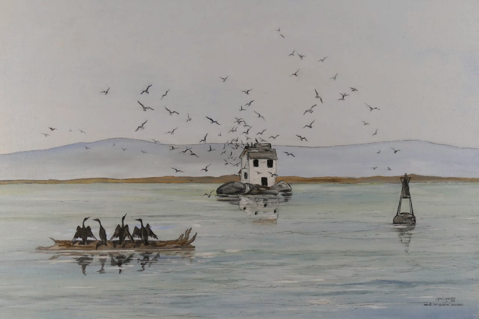
Lars Larsen, Baie de Gaspé , huile sur aggloméré, 66 x 96,5 cm, 1979. Collection Musée de la Gaspésie. Don de l'artiste