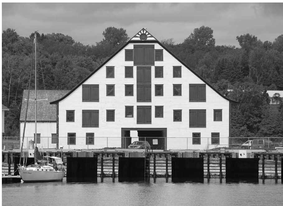
Le Site historique du Banc-de-Pêche-de-Paspébiac est l'un des attraits patrimoniaux majeurs du circuit touristique gaspésien.