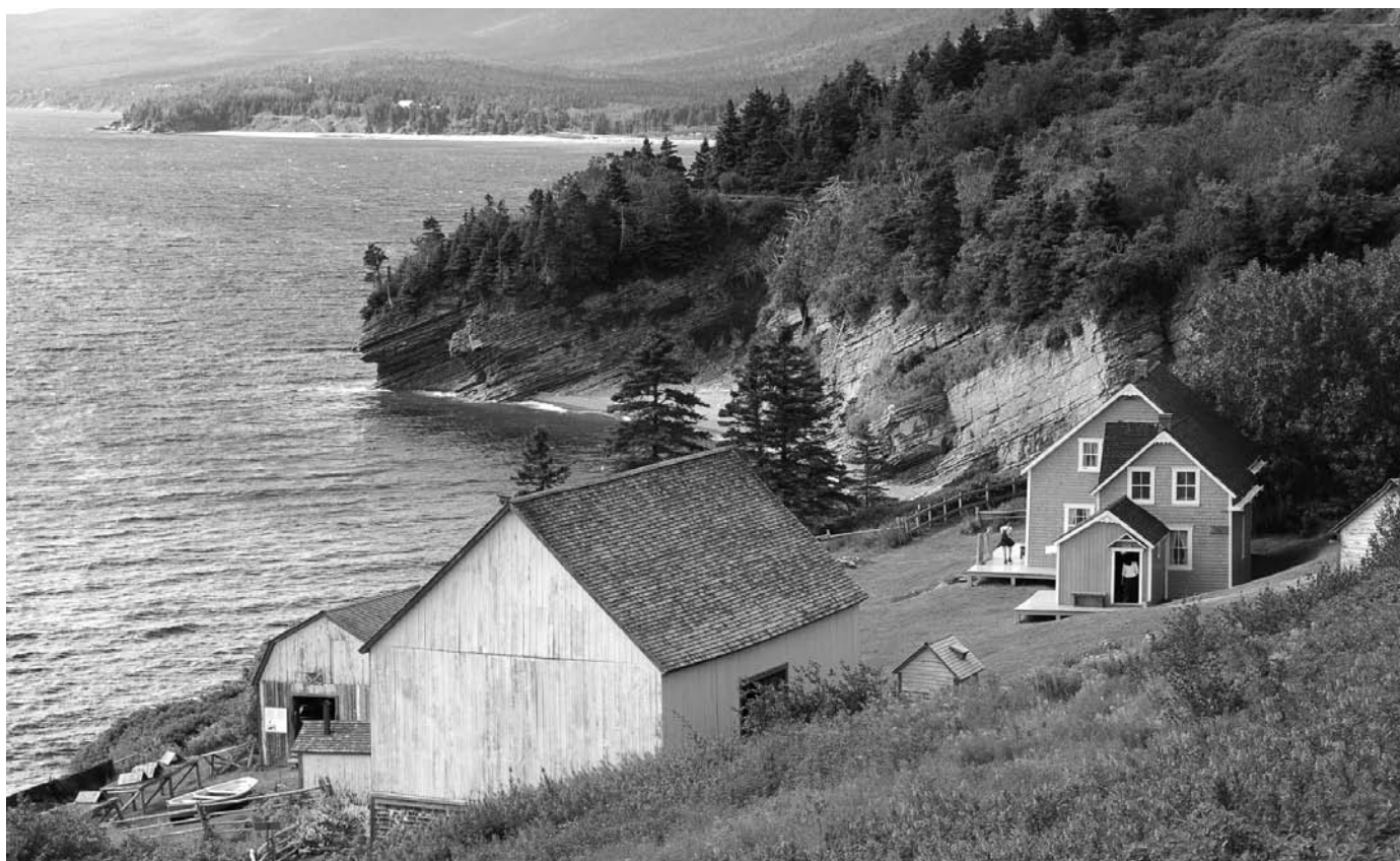
L'anse Blanchette dans le parc national Forillon, une image de marque dans la promotion touristique de la Gaspésie.