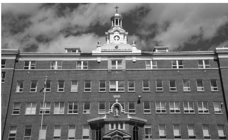
Depuis 1968, les Gaspésiens ont accès aux études collégiales. Le Cégep de la Gaspésie et des îles à Gaspé. Photo : Jean-Marie Fallu, 2009.

subventions au transport de marchandises en région (1999) est un autre coup dur pour la survie du train en Gaspésie. La même situation prévaut en transport maritime. Transports Canada met en place (1995) un programme d'abandon de ses ports, de ses quais et de ses phares. Une liaison maritime, établie entre Carleton et les Îles-de-la-Madeleine (1995), sera abandonnée (1996) et reprise entre Chandler et Les-Îles (2000). En 1994, le fédéral se retire également de la propriété et du financement des aéroports locaux et régionaux.