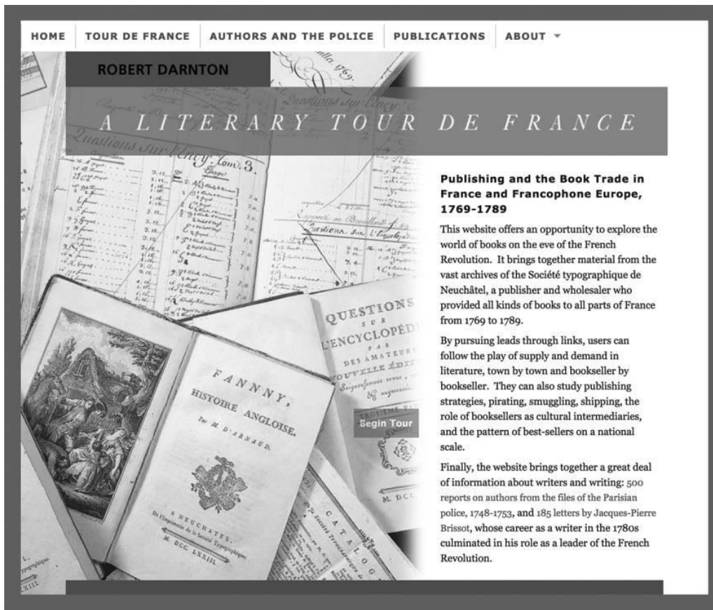
Figure 1. Page d'accueil du site Web www.robertdarnton.org . Image couleur accessible en ligne.

Le contenu est disposé en couches pour que les lecteurs puissent traverser ces strates d'information en fonction de leurs intérêts, tout en gravitant autour de la question centrale de la demande de livres. Avant de plonger, toutefois, ils s'interrogeront sans doute quant à la méthodologie et aux sources utilisées. L'article vise, en troisième lieu, à fournir à ces questions des réponses qui pourront se révéler utiles aux historiens d'autres disciplines soucieux d'élaborer une stratégie de recherche efficace.