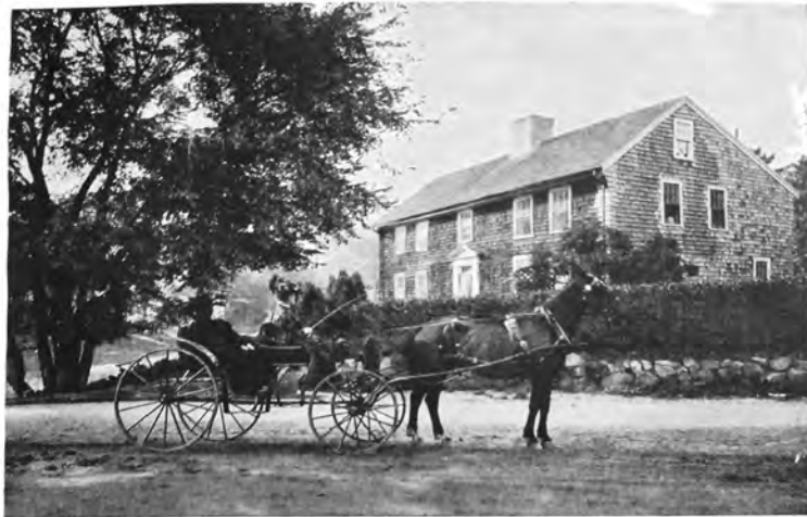
When you are on a hunt for old china or furniture in the country be on the look-out for houses like this

exemple Matson 1874 : 174 passim). En 1878, le Harper's Weekly résume ce mouvement dans un article illustré, « The Rage of Old Furniture », consacré au « zèle enthousiaste qui a dévalisé tant de maisons rurales » (16 novembre 1878 : 917). Une gravure montre un New-yorkais quittant une ferme, ravi, un rouet sous le bras ; une autre montre une foule devant une maison rurale, ironiquement sous-titrée : « La rumeur s'est répandue qu'une vieille dame a de vieilles faïences de Chelsea ; quelques collectionneurs viennent la voir ». Les guides sur les alentours de New York recommandent de prêter attention aux fermes et aux foires (Drake 1876 ; Bayles 1885 ; New England, A Handbook for Travellers 1888) et de nombreux ouvrages sont publiés pour aider à identifier les objets coloniaux 58 . Pragmatique, Dyer montre par la photographie le genre de maisons et de fermes où l'on peut faire des trouvailles, rappelant qu'à défaut de monuments, les racines européennes de la région de New York existent à travers les objets (Dyer 1910). En complément se multiplient les manuels qui inventorient les « maisons coloniales » authentiques (voir par exemple Eberlein et Lippincott 1912).