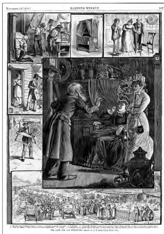
Fig. 8 (en bas) « The Rage for Old Furniture », Harper's Weekly, 18 novembre 1878.

À partir des années 1870, de nombreux touristes américains se mettent eux aussi à