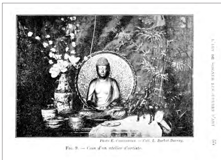
Fig. 9. — Coin d'un atelier d'artiste.

« Au-dessus d'une armoire normande [...], des flèches au dard acéré, des massues terribles, des sagaies primitives, des lances emplumées, des poignards barbares, des sabres sauvages qui rayonnent autour d'un immense chapeau de paille marocain » (Eudel 1888 : 374). Les nombreux ateliers de peintres « exotisants » à New York et à Paris apparaissent comme des espaces intérieurs où la rêverie vers les lointains peut se développer sans entraves 74 car « dans les ateliers, on est évidemment dans un autre monde », coupé de la ville (Duranty 1881 : 153 ; voir aussi Wolff 1881 : 146 passim ). Derrière la façade de l'hôtel