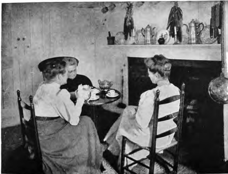
If the inhabitant of the house invites you to have tea in her old china, you are in luck