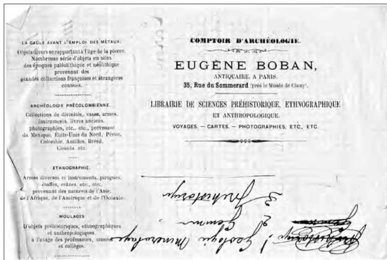
Fig. 7 Facture à en-tête de la maison Eugène Boban avec ses nombreuses spécialités—antiquités, archéologie précolombienne, ethnographie...—Fonds Eugène Boban, Hispanic Society of America, New York City, Box II.

Plus radicalement, ces textes promeuvent un bibelotage hors du commerce, dans le quotidien. Nombreux à déplorer la perte des singularités locales—la Bretagne se « désembretonne » dit Flaubert (1924 : 122-23)—, ils invitent à sauver les traces de mondes menacés, en France, aux États-Unis comme à l'autre bout du monde. Les textes de militaires et de collectionneurs soulignent que les vraies trouvailles se font en arrachant les objets au quotidien où ils sont, ou ont été, en usage. La recherche d'armes « sauvages » mène ainsi Melchior Yvan dans les villages malaisiens car « un touriste qui sait son monde se garderait bien d'acheter ces instruments redoutables à d'autres qu'à ces farouches insulaires » (1855 : 215-17). À propos du Japon, on peut écrire que « ces courses