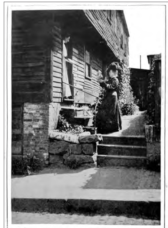
Don't expect to buy these old treasures for a song You are lucky to get them at all