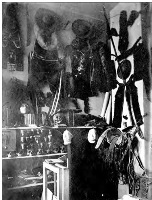
Fig. 1, 2 Coins de la boutique de l'antiquaire et marchand de curiosités Eugène Boban, boulevard Saint-Germain ou rue Du Sommerard, vers 1875. Fonds Eugène Boban, BnF Manuscrits et Hispanic Society of America, New York City, Box II.

de multiples par courrier 13 . En retour, les amateurs envoient des photographies de leurs objets à vendre et d'eux-mêmes avec leur collection 14 . Se met ainsi en place une publicité de l'objet unique à l'échelle internationale.