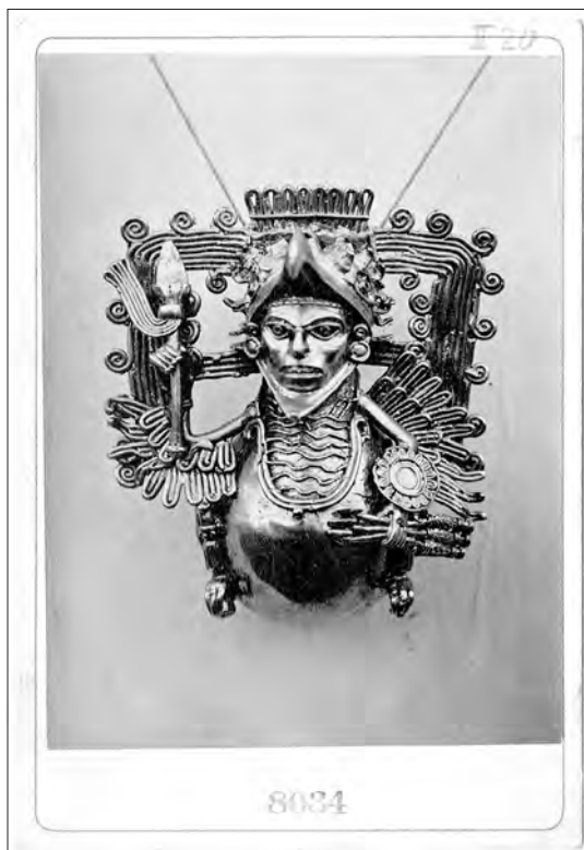
Fig. 4 Photo-carte de visite publicitaire d'un objet pré-colombien, Fonds Eugène Boban, Hispanic Society of America, New York City, Box II.

goûte une peinture documentée, les orientalistes travaillent à partir de collections d'objets pour dépeindre une « couleur locale » (Eudel 1888). En retour, leurs tableaux servent de publicités. Boban, qui fournit Jean-Paul Laurens en objets mexicains, utilise le succès de ses tableaux à des fins publicitaires 15 et le Bon Marché s'associe avec Gérôme dans les tableaux duquel les