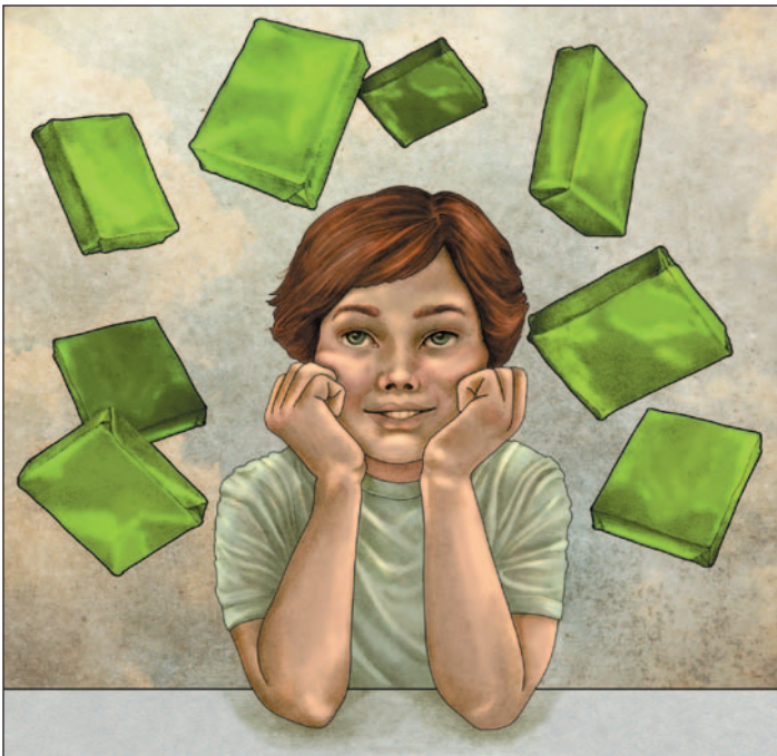
illustration : Laurine Spehner

Maxime observa le paquet, à peine plus grand qu'une main, et se dit que l'homme devait sûrement souffrir de la faim, même s'il se dépensait peu, assis dans son fauteuil roulant. Le jour suivant, Maxime attendit le vieux monsieur. Quand celui-ci vint chercher son paquet, Maxime lui tendit un sac de papier. En y découvrant un sandwich, une pomme, une tablette de chocolat et un berlingot de lait, l'homme resta un moment silencieux, puis éclata de rire.