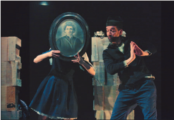
Le petit cercle de craie.