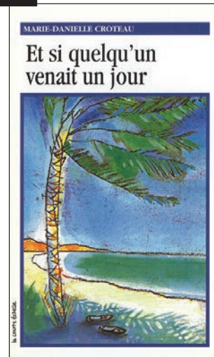
Édition originale, 2002