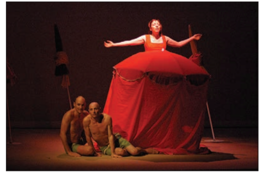
La robe de ma mère