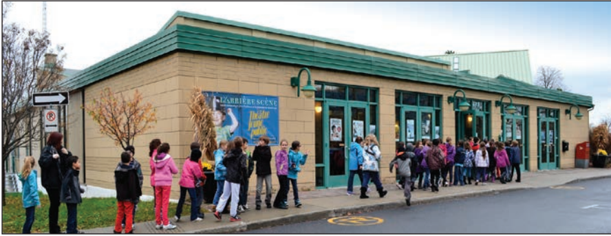
Le centre culturel de Belœil

visuels, n'a pas toujours écrit. Il explique que ses premiers spectacles n'étaient pas du théâtre à texte. Le texte était un élément de la représentation parmi d'autres, l'aspect visuel, évocateur et poétique, étant souvent prioritaire. En invitant des auteurs à lui soumettre des textes, il s'est rendu compte qu'il avait la capacité de mettre en scène les textes des autres, lui qui se considère comme un autodidacte. Petit à petit, il s'est rapproché de ses propres préoccupations. La majorité aidant, il constate : «Moi-même, c'est avec La robe de ma mère que, pour la première fois, j'ai commencé par écrire les dialogues, et non par la mise en scène. Avant, je créais une sorte de scénario, comme au cinéma, et après j'ajoutais les mots pour construire les scènes. Avec La robe... , je me suis lancé directement avec les personnages, et je pense que c'est ce qui a permis d'intéresser un metteur en scène.»