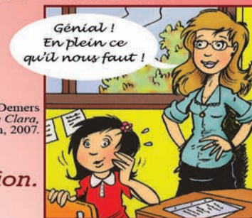
Illustration : Tristan Demers Les lunettes de Clara , Éd. Hurtubise, coll. Caméléon, 2007.

courriel : sonia_k_laflamme@yahoo.fr / site Internet : www.soniaklaflamme.com