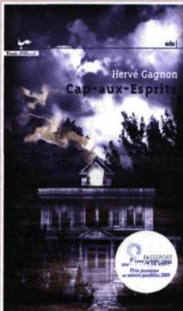
Illustration : Lauriane SPRATNER