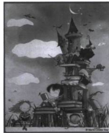
Lire me sourit

Quel est donc le prétexte d'une telle page couverture? Qui est cette princesse au long manteau rose et à la couronne dressée? Pistache fait ici le jeu d'un immense malentendu : pour avoir reçu le cadeau (non signé) d'une couronne adressée «À ma princesse», voilà que l'enfant se trouve des origines nobles et attend qu'on vienne la chercher pour la conduire dans son château. Un rêve, quoi! Celui de beaux vêtements et, surtout, celui de faire seulement ce qui lui plaît, quand cela lui plaît, d'obtenir tout ce qui lui passe par la tête... la vraie vie de princesse. La situation se retourne quand sa petite sœur (qu'elle a envoyé paître) disparaît. Climat d'inquiétude, de tourment. Tons peu constatés, embrouillés, sombres aussi. Pistache vit les affres de la culpabilité et cherche à tout prix à retrouver sa sœur Pauline. Les maisons tapies sur la colline ont quelque chose d'irréel, de froid, d'ailleurs. Ce lieu n'est pas un vrai lieu. Où donc chercher la petite? Pistache marche sur une petite butte, elle n'est plus la princesse que d'un piètre royaume! Le reflet blanc court sur son menton et sur son dos comme un frisson d'effroi. La petite prin-