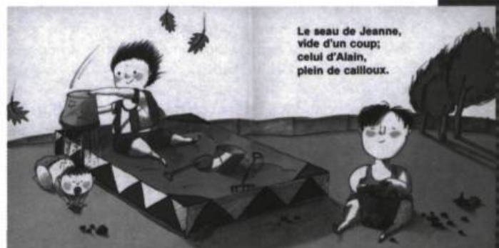
Petit et grand

Autant Marie-Louise Gay semble s'amuser à peindre, dans ses pages colorées, des situations concrètes et pro-