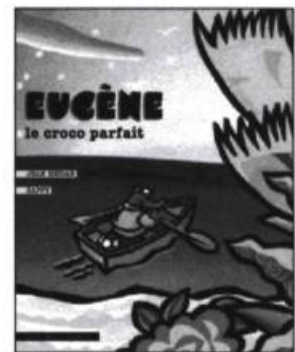
Eugène, le croco parfait Jean Heidar - Zappy