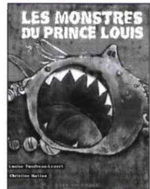
Les monstres du prince Louis Louise Tondreau-Levert - Christine Battuz