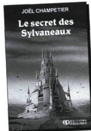
LE SECRET DES SYLVANEUX Joël Champetier 160 pages * 7,95$

Un matin, en traversant le parc pour se rendre à son cours de flûte, Sylvianne fait une macabre découverte : il y a un cadavre dans la glissoire! Pour l'auteure Francine Pelletier, il s'agit d'un dixième titre dans la collection Jeunesse-Pop .