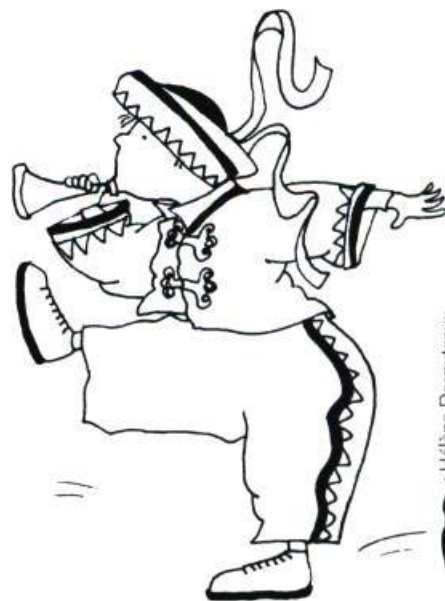
: Hélène Desputeaux

Les prix, d'une valeur de 7500 $ chacun, seront remis le 12 mai à Toronto. Ω