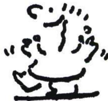
Illustration: Philippe Béha