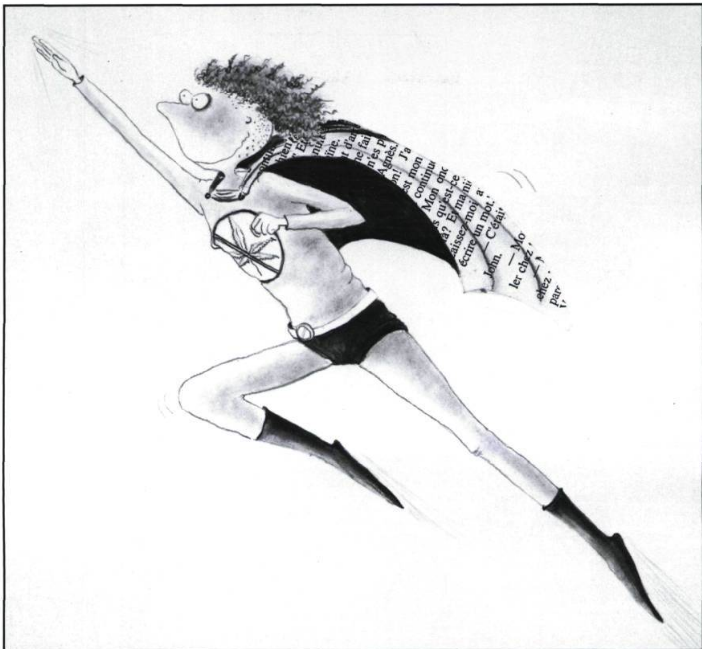
Illustration: Dominique Jolin