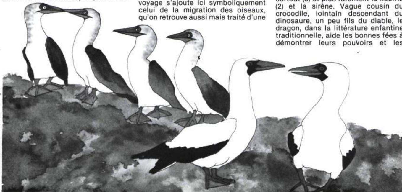
Illustration: Pam Hall — Pierre Tisseyre

Encore une étape de plus et nous voilà dans le merveilleux. En fait, plus encore que migrants, Les oiseaux couleur d'arc-en-ciel sont des oiseaux merveilleux. Issus de l'imaginaire autant que du réel, les animaux merveilleux font rêver l'enfant à tous les grands espaces, ceux de l'univers et ceux du rêve. Ils sont nombreux (21) mais entre eux il y a des différences cependant; j'ai pu en distinguer deux sortes chez les auteurs québécois. Les bêtes fabuleuses tout d'abord, le dragon surtout (5) et plus rarement la licorne (2) et la sirène. Vague cousin du crocodile, lointain descendant du dinosaure, un peu fils du diable, le dragon, dans la littérature enfantine traditionnelle, aide les bonnes fées à démontrer leurs pouvoirs et les