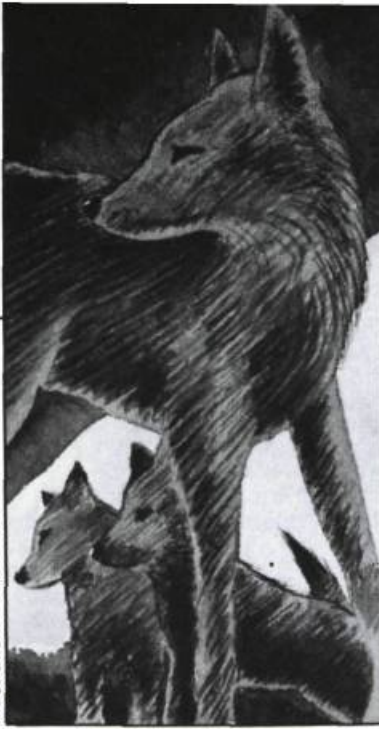
illustration: Bernard Méouille — Mondia

paresseux , Pareil pas pareil , Le dragon des pêcheurs , Jean-Jean Dumuseau , Les feux follets , La sirène de Percé , etc. Dans les albums traduits, le Petit Castor, ce Robin des bois animal des temps modernes, en est peut-être le prototype: déjouant les ruses de Finaud le renard, il sauve un Aiglon , protège son amie Lili, aide son père ( Le barrage ). L'enfant se reconnaît avec plaisir dans ce sympathique petit castor sans mère et transfère sur lui ses besoins de générosité, de débrouillardise et d'affection.