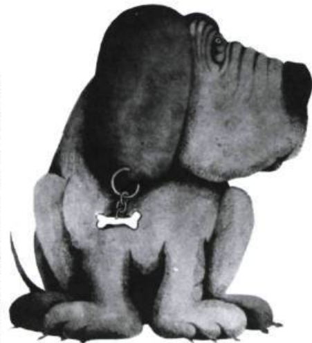
Illustration: Roger Paré — La courte échelle