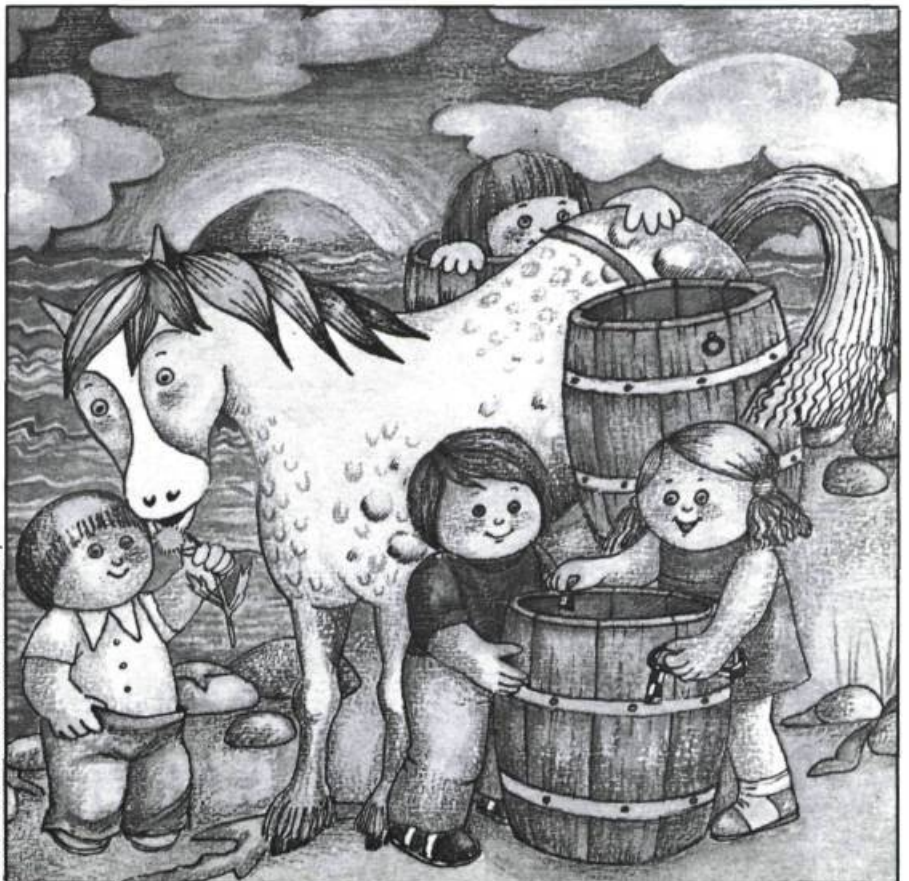
illustration: Hélène Couture — Édi-teq