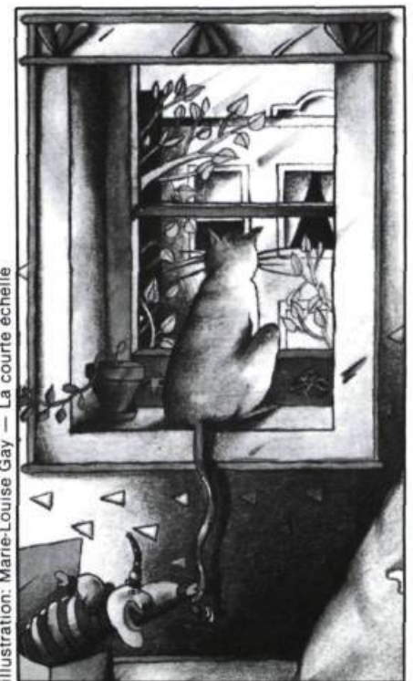
illustration: Marie-Louise Gay — La courte échelle

Premières conquêtes de l'homme, dit-on, le chat et le chien sont incontestablement celles de l'enfant, du moins si l'on se fie aux histoires écrites pour lui. Dès qu'un auteur représente une famille, une maison