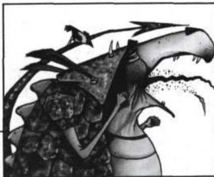
Illustration: Philippe Beha — Paulines

emploi: anthropomorphisme, transfert, humour, s'ajoutent des préoccupations bien contemporaines, certaines proprement québécoises: le refus de la violence, la défense de l'environnement et des bêtes sauvages, le recours à la faune nord-américaine, la démystification de vieux mythes comme celui de la bête féroce. Les auteurs pour enfants se servent de la puissance de l'imaginaire et de la beauté des illustrations pour faire passer leurs messages. Et pour arriver jusqu'au cœur et jusqu'à l'intelligence de l'enfant, ils savent qu'il n'y a pas de meilleur chemin que celui de l'animal.