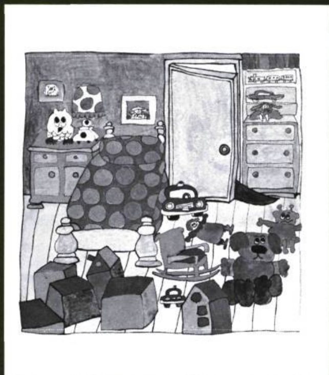
La cachette , Texte et illustrations de Ginette Anfousse, Les Editions La courte échelle, Montréal, 1976 et 1978, Album broché de 24 pages, Illustrations en couleur.