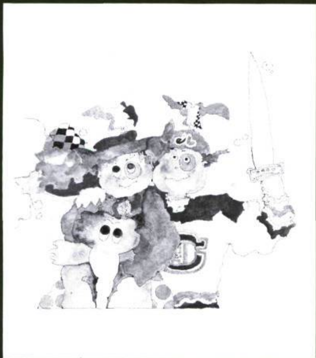
La chicane , Texte et illustrations de Ginette Anfousse, Les Editions La courte échelle, Montréal, 1978, Album broché de 24 pages, illustrations en couleur.