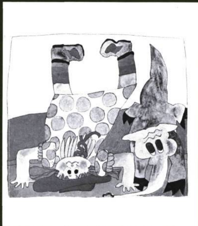
Mon ami Pichou , Texte et illustrations de Ginette Anfousse, Les Editions La courte échelle, Montréal, 1976 et 1978, Album broché de 24 pages, Illustrations en couleur.