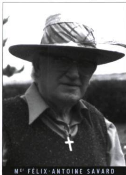
M. FÉLIX-ANTOINE SAVARD

Il célèbre, en fredonnant, ce lacis de nerfs et de force avec lequel ses pères ont battu les neiges qui, depuis trois cents ans sont tombées du ciel, ce signe de leur victoire sur le champ rigoureux des hivers infinis. (1967) (p. 229)