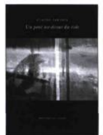
Claude Paradis Un pont au-dessus du vide