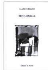
Alain Cuerrier Ritournelle

la collection Initiale : de nouveaux auteurs, de nouvelles voix