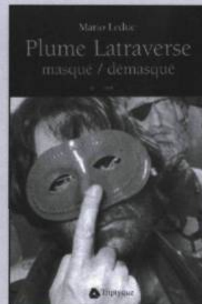
MARIO LEDUC Plume Latraverse masqué / démasqué essai, 226 p., 22 $

«Les gens ont fait le choix de te ranger pour toujours dans un cercueil étanche et insonorisé. Moi je te propose un nid de feuilles tout près de la vie qui jase. Installe-toi. Vois comme je t'écris. Ne t'arrête pas au décès qui n'a plus d'importance. Entre avec moi dans le pays handicapé par la sécheresse, dans la villa blanche rue des bougainvillées, saisis ta Lucia, repartons tous à bord du ferry, for ever sur le ferry...»