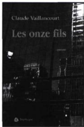
Claude Vaillancourt LES ONZE FILS roman, 615 p., 25 $

En se réveillant d'une brosse de vingt ans, Paul Dubé découvre un drôle de message sur son répondeur. S'enclenche alors une suite d'événements qui amènent à remonter le temps. Raconté avec une ironie mordante, ce roman évoque les années 70 sans verser dans le mythe de l'Âge d'or véhiculé par les fabricants de nostalgie. Une histoire galopante servie par une écriture qui ne mâche pas ses mots.