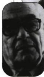
Jean Paul Lemieux