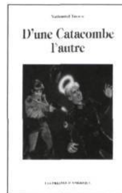
Nathaniel Thorne D'une Catacombe l'autre 175 p., 20 $