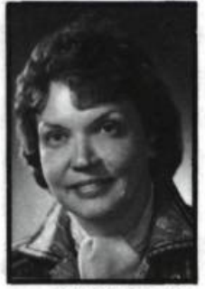
par Gabrielle Poulin