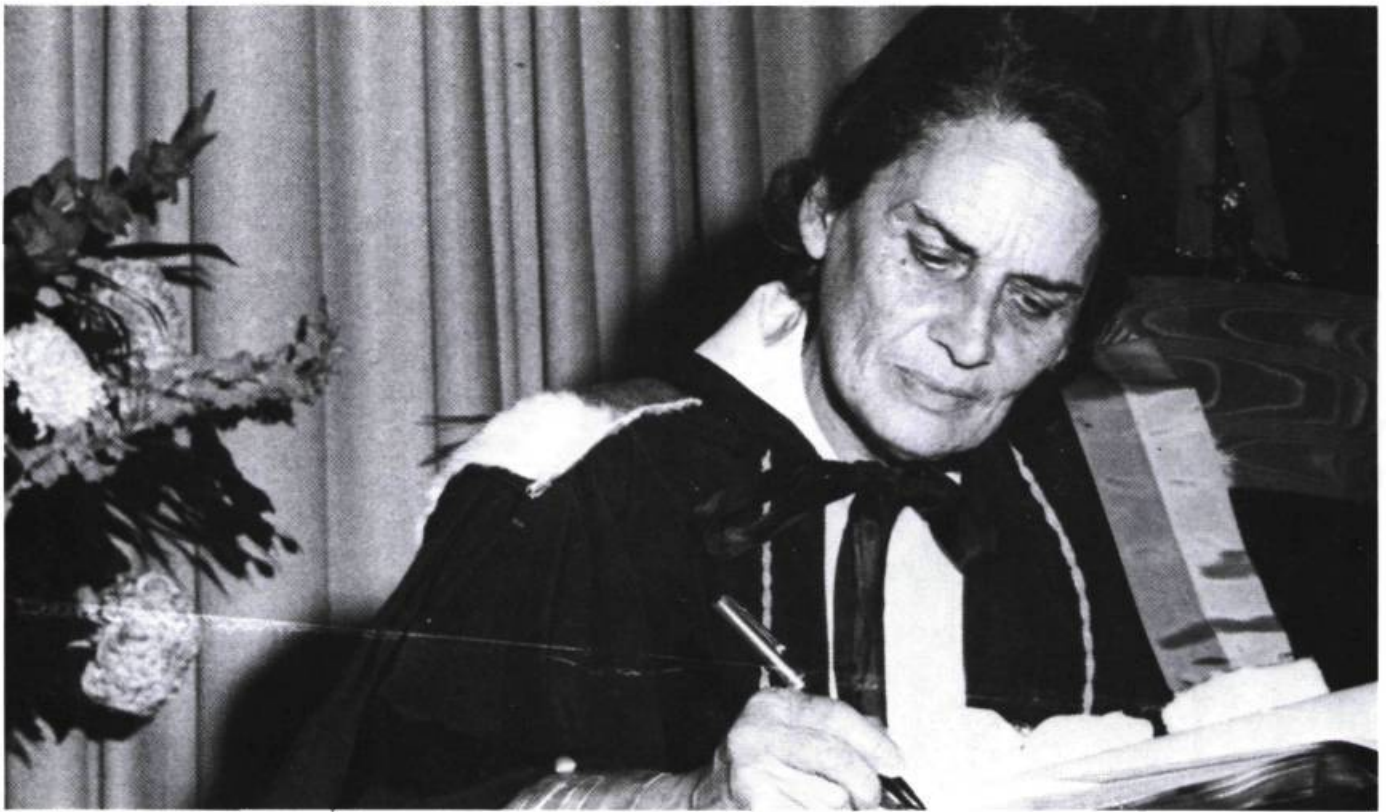
Gabrielle Roy après avoir reçu un doctorat à Laval il y a quelques années.

La jeune institutrice n'a qu'un pas à faire pour retourner sur le seuil de l'adolescence où se trouve Médéric. Qu'ensemble ils réussissent à s'éloigner un moment des murs de cette école du réel, de ce village où veille la bonne conscience soupçonneuse, et le rêve initiatique et libérant, comme jadis celui du Grand Meaulnes , pourra prendre forme. Mais il fallait que « l'école » existe, que l'un après l'autre, Vincenzo, Clair, Nil, Demetrioïff et André permettent à la jeune institutrice de se préparer pour le jour où le rêve passionné, piaffant et caracolant, surgirait de l'horizon. De chacun de ces petits, la narratrice n'a retenu qu'un aspect. Vincenzo était violent dans ses colères et dans son amour :