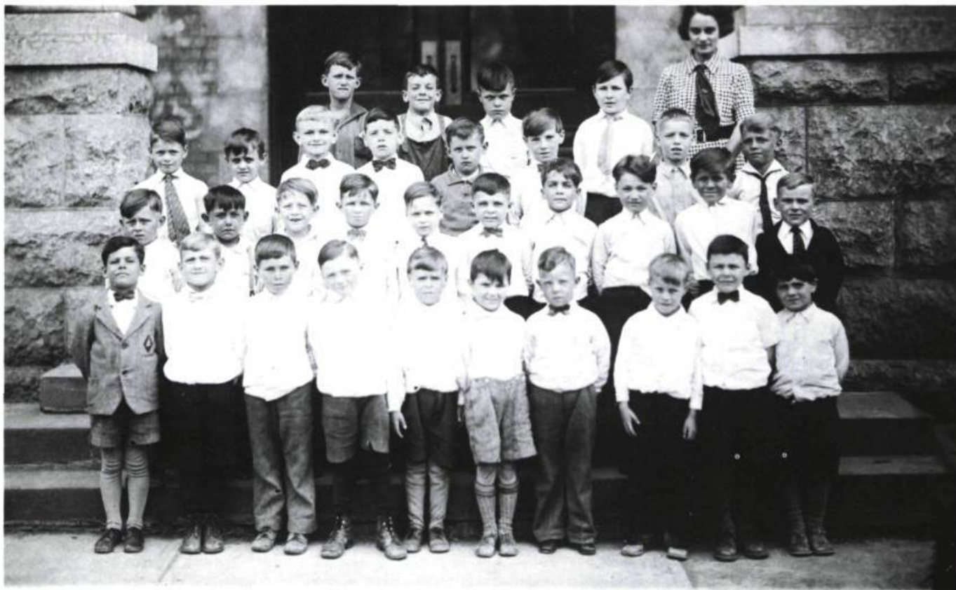
En haut, Gabrielle Roy avec sa classe à la Petite poule d'eau . En bas, à gauche, à 22 ans, à l'Académie Provencher et à droite, à Prats-de-Mollo en 1939, à la frontière franco-catalane, avec des petits réfugiés catalans.