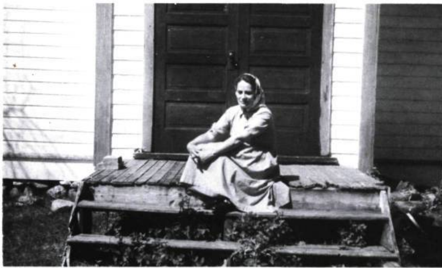
L'auteur sur le perron de la chapelle de la Petite poule d'eau, 1955.