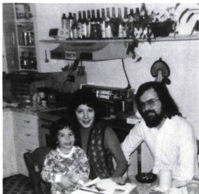
avec sa famille