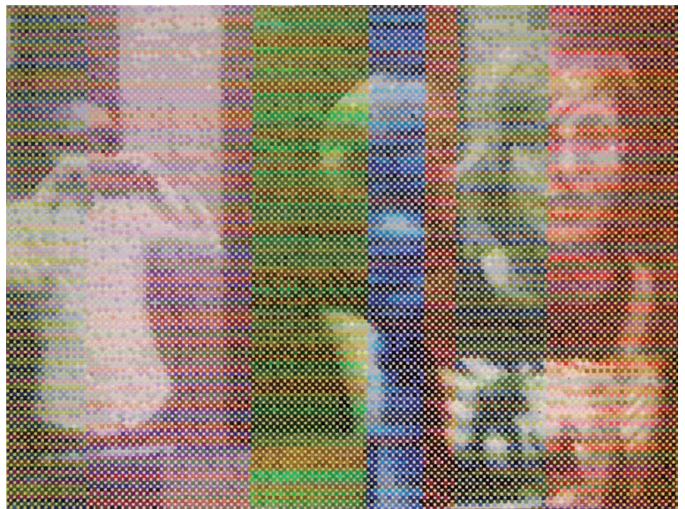
Mark Stebbins, Echoes , 2018, acrylique sur panneau de bois, 12" x 16".

dans le tableau Grandmothers , émotivement chargé pour l'artiste car il représente ses deux grands-mères défuntées. Comme dans ses autres tableaux, celui-ci est composé d'une matrice de petits carrés dont un sur deux est vide. L'œuvre partiellement peinte illustre la disparition des ancêtres, le sentiment de perte qui l'accompagne et la volonté de lutter contre l'effacement en s'accrochant à la matérialité du souvenir.