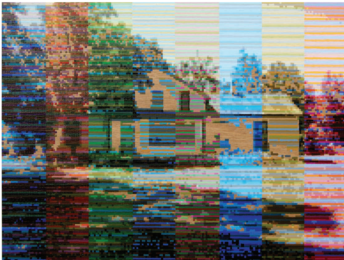
Mark Stebbins, Ruin , 2018, acrylique sur panneau de bois, 12" x 16".

Stebbins s'appuie d'abord sur une recherche photographique. Il accumule des photos prises au quotidien, puis il retient parmi celles-ci celles qui conviennent le mieux à son propos. À l'aide de logiciels informatiques, il réduit le nombre de pixels des instantanés photographiques, dégradant ainsi l'image d'origine. Cette opération vise à illustrer le processus de désintégration de la mémoire et à suggérer sa fragilité, son impermanence.