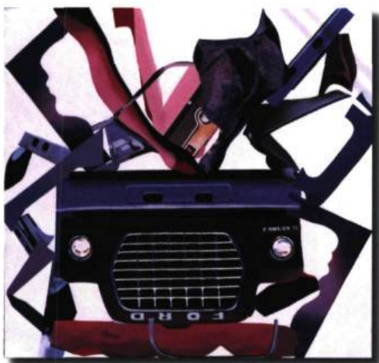
Ford à l'envers, acrylique sur toile, 119X114, 1973 Photo: Daniel Rousseau

femmes. Pauline approfondit son engagement en devenant membre de Powerhouse en 1979, et ce, jusqu'en 1987. Elle y est très active, siégeant un temps au comité d'administration. Son adhésion l'amène à y exposer en solo un Environnement calligraphié sur papier de riz (1982) et à participer à plusieurs expositions des membres, tant à la galerie de Montréal qu'à Langage Plus à Alma, au Québec, et au Women's Art Centre de Washington (D.C.). Le fait d'armes dont elle est le plus fière, toutefois, c'est d'avoir été l'instigatrice, avec trois autres ex-membres de la galerie (devenue La Centrale), du dépôt des archives de Powerhouse aux Archives de l'Université Concordia, à Montréal.