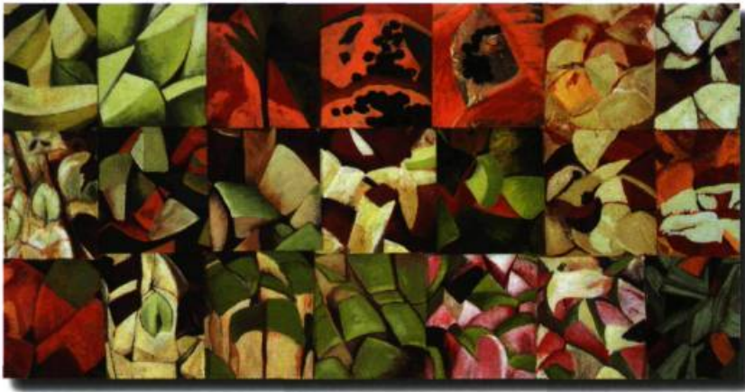
Composition en sol n° 8 , acrylique sur toile, 186 X 218 cm, 2002