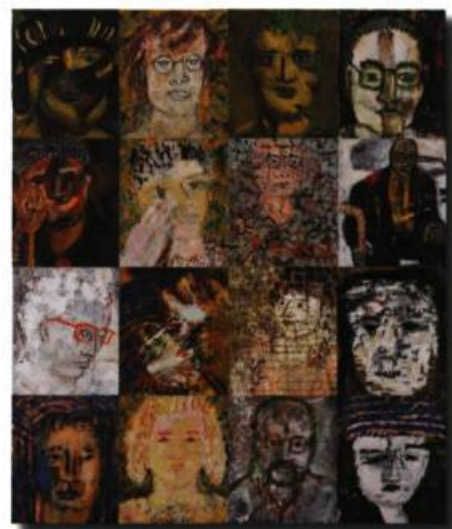
Portraits, acrylique sur toile, 122X103 cm, 2007

À Montréal, Pauline Morier trouve une tribune dans les expositions de groupes montées par le réseau des maisons de la culture. En 1988, elle participe à l'exposition itinérante L'élément humain , organisée par le Conseil des arts de la communauté urbaine de Montréal. Suivront L'éclat d'un