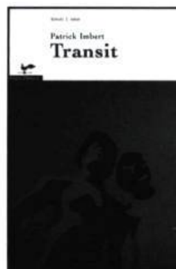
Patrick Imbert, Transit , Vents d'Ouest, 2001, 213 p.