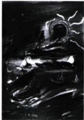
Apocalypse, acrylique sur toile, 1986.