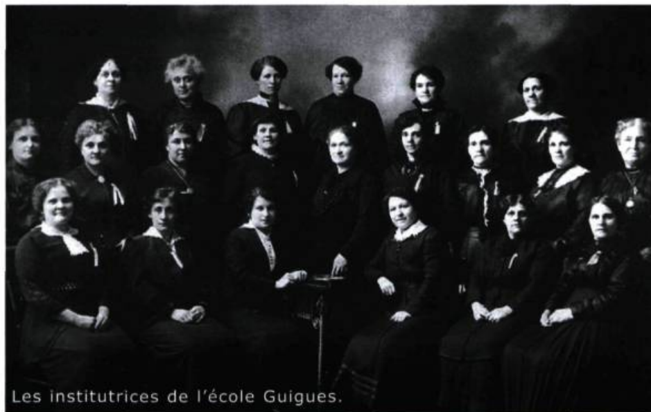
Les institutrices de l'école Guigues.

Comble de sophisme, monsieur, vous affirmez que « les droits des minorités sont des droits réels parce qu'une grande partie de l'intelligence de toute civilisation vient de ses minorités. On peut dire que de façon générale les majorités dépendent des minorités ». Et vous coiffez cette assertion de ceci : « ce que je suis en train de vous dire, vous ne l'entendrez pas de la bouche d'un professeur de sciences sociales ». À cette opinion, je rétorque pourquoi pas ? Et je vous suggère la lecture d'un remarquable petit livre dont le sérieux vous amènera sans doute à nuancer votre jugement. Son contenu met en lumière la vulnérabilité des droits des minorités et démontre