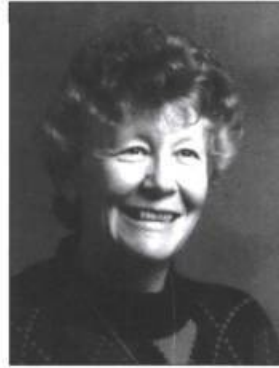
MONIQUE GENUIST L'Île au cotonnier Roman