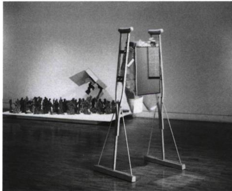
À l'arrière-plan : « MÉMOIRE À PHARMACIE », de Paul Walty ; à l'avant-plan : « SANTÉ BOITEUSE », de Lagaan.

Est-ce que l'exposition Premiers soins est maintenant remise dans l'armoire ? Oui, pour le moment, mais on songe à une éventuelle tournée. Selon la conservatrice, il y aurait déjà un intérêt et « c'est notre espoir de pouvoir bientôt explorer certaines pistes ». Pourvu que Harris ne coupe pas dans les premiers