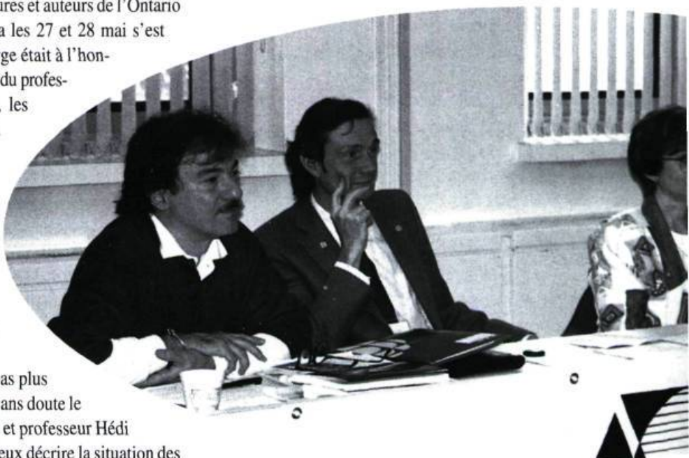
TABLE RONDE SUR LE PUBLIC LECTEUR.

S'il n'y a pas de page sans marge, il n'y a pas plus de littérature sans marginalité. Certains préfèrent sans doute le mot «diversité» à celui de «marginalité». Le poète et professeur Hédi Bouraoui n'hésite pas à inventer des mots pour mieux décrire la situation des francophones de l'Ontario. Il y a les écrivains de la «souchitude» et ceux de l'«originalitude», les premiers étant des francophones de souche ou des Franco-Ontariens tricotés serrés, les seconds étant des Néo-Canadiens d'horizons différents et de facettes multiples, à l'image de l'original qui présente tout à la fois les aspects du daim, du cerf et du cheval. Il en résulte donc une production littéraire où toutes les tendances sont présentes. Mais cette réalité