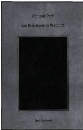
Nouvelle édition du livre primé en format de poche.

Je dis que c'est cela qui se passe, en effet, quand les «petites» littératures cherchent à être reconnues et acceptées dans la grande littérature. Mais justement, si tu écris pour être accepté, si tu essaies d'imiter les modes de discours de l'autre, tu te perds. Une des grandes réussites de l'Ontario français depuis vingt ans, c'est son théâtre. Or, ce type de théâtre n'aurait jamais pu se développer dans les cadres de la grande institution littéraire. Plusieurs pièces marquantes n'ont même pas été publiées. L'oralité et la création collective y sont pour beaucoup. Notre théâtre prend vie dans une communauté et il la fait vivre. C'est vrai que si on