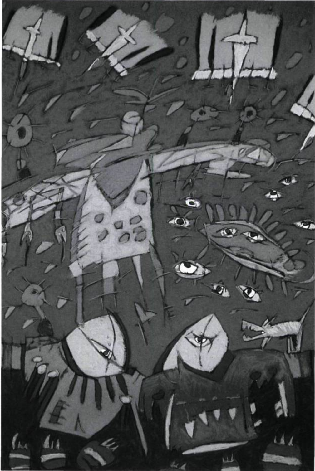
Stratège : La Grande Ourse, 1989