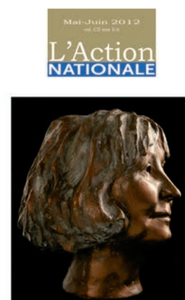
Louky Bersianik L'œuvre souveraine

Nos grands numéros littéraires sont disponibles à la boutique action-nationale.qc.ca