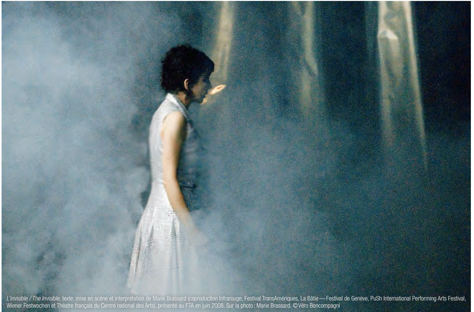
L'invisible / The Invisible , texte, mise en scène et interprétation de Marie Brassard (coproduction Infrarouge, Festival TransAmériques, La Bâtie—Festival de Genève, PuSh International Performing Arts Festival, Wiener Festwochen et Théâtre français du Centre national des Arts), présenté au FTA en juin 2008. Sur la photo : Marie Brassard.

dans l'immobilité, me captivaient. Cette audace à plonger dans le réel à une autre vitesse, ce courage d'embrasser l'abstraction, me touchait au plus profond de mon être. Je reconnaissais là quelque chose, comme si, de tout temps, j'avais eu en moi ce savoir, qui ne demandait qu'à être validé pour s'épanouir.