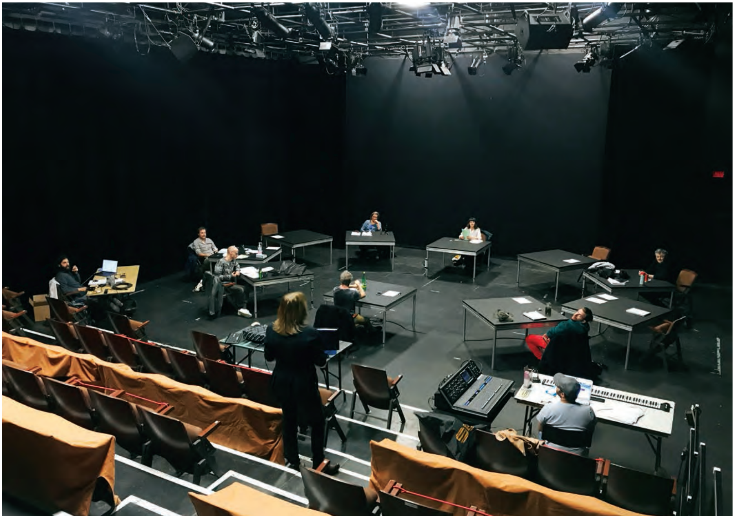
Forêt et Tempête (Faust, première partie) , laboratoire de création sur des textes de Marine Bachelot Nguyen, Pauline Peyrade et Guillaume Poix, sous la direction de Florent Siaud (Théâtre Prospero), tenu du 2 au 9 octobre 2020 lors de l'événement Territoires de paroles.

Les résidences et les laboratoires ne se sont pas multipliés, malgré les exemples exposés sur le site de Jeu en octobre dernier. La débâcle fait en sorte que les programmations sont pratiquement impossibles à construire pour les années à venir. On risque alors d'assister à la désertion des contenus, vides de nouvelles pièces d'ici, et pleins de reprises et d'œuvres venues d'ailleurs. À quand un panier bleu en théâtre ?