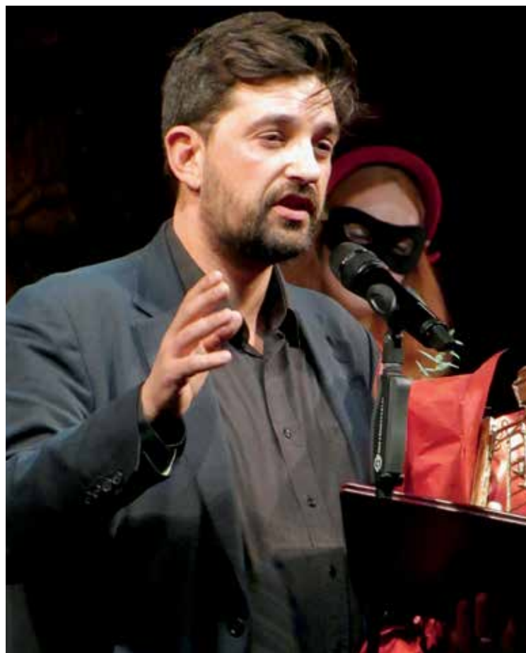
Tiago Rodrigues, lauréat d'un prix Réalités théâtrales, récitant le sonnet 30 de William Shakespeare en russe, avant de le dédier à Kirill Serebrennikov.

théâtrales et directeur du Grand Théâtre dramatique de Saint-Petersbourg, l'œuvre se démarque par une scénographie grandiose où évoluent pas moins de 50 interprètes, se prêtant à des chorégraphies réglées au quart de tour et à des changements de décors et d'ambiances impressionnants. Projections vidéo, éclairages sophistiqués, maquillages expressifs et costumes d'époque, qualité du jeu remarquable, tout concourt à créer l'émotion presque insoutenable de ce spectacle, le premier d'une courte série mettant en scène la guerre, implacable et redoutée.