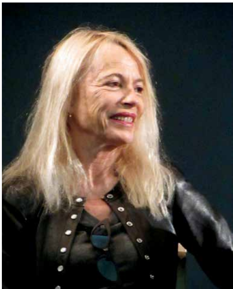
Laure Adler, venue rendre hommage à Tiago Rodrigues, « un jeune homme qui réinvente le théâtre », lors de la remise du Prix Europe à Saint-Petersbourg, en novembre 2018.

Alors que l'Europe paraît plus désunie que jamais, que des gouvernants extrémistes adoptent des politiques qui divisent, créant l'inquiétude devant d'éventuels nouveaux conflits, la Russie, [...] a intérêt à voir ce type de réunion culturelle se tenir sur son territoire afin de redorer son image.