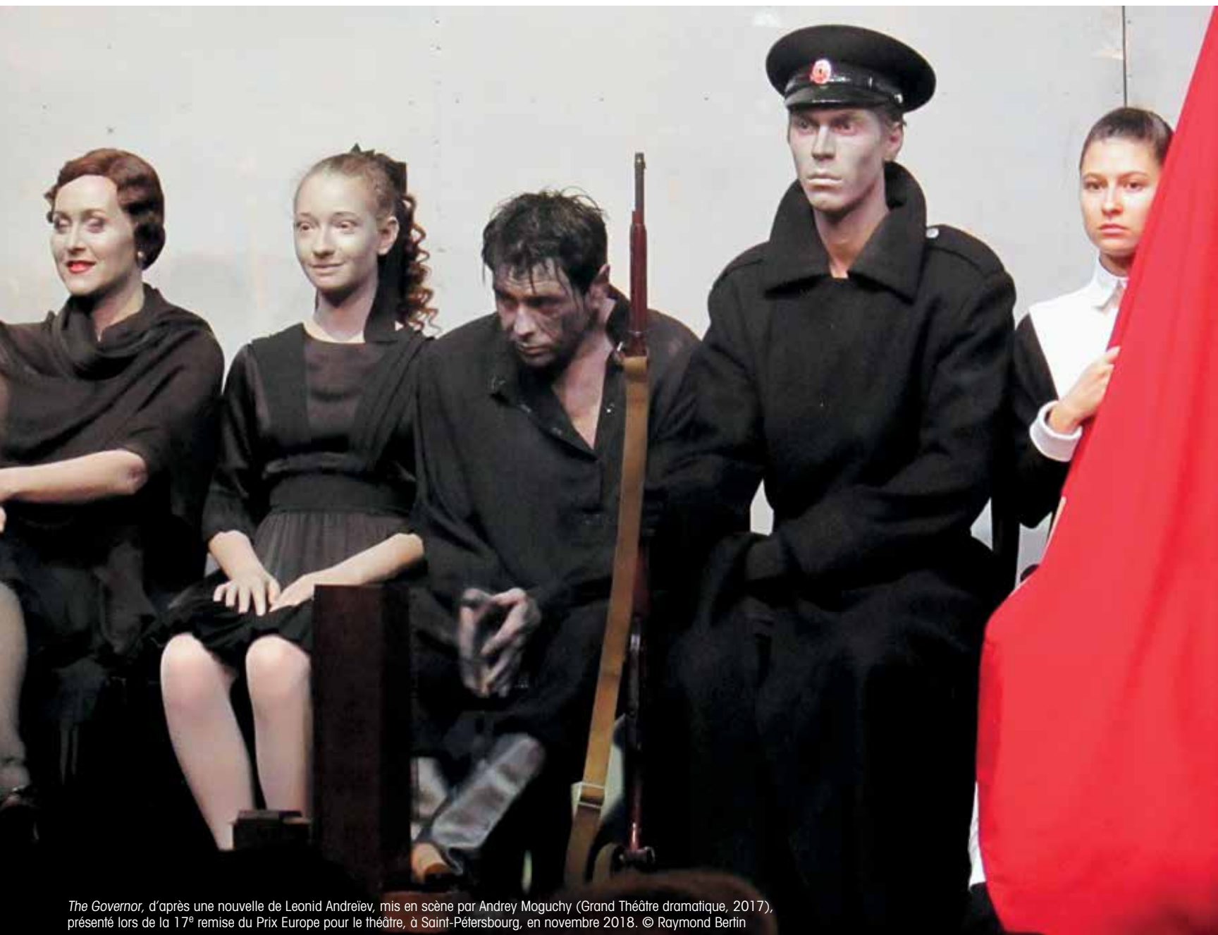
The Governor , d'après une nouvelle de Leonid Andreïev, mis en scène par Andrey Moguchy (Grand Théâtre dramatique, 2017), présenté lors de la 17 e remise du Prix Europe pour le théâtre, à Saint-Petersbourg, en novembre 2018.

À l'occasion de la remise du Prix Europe pour le théâtre à Saint-Petersbourg, artistes russes et européens se sont serré les coudes, dans une atmosphère de guerre appréhendée.