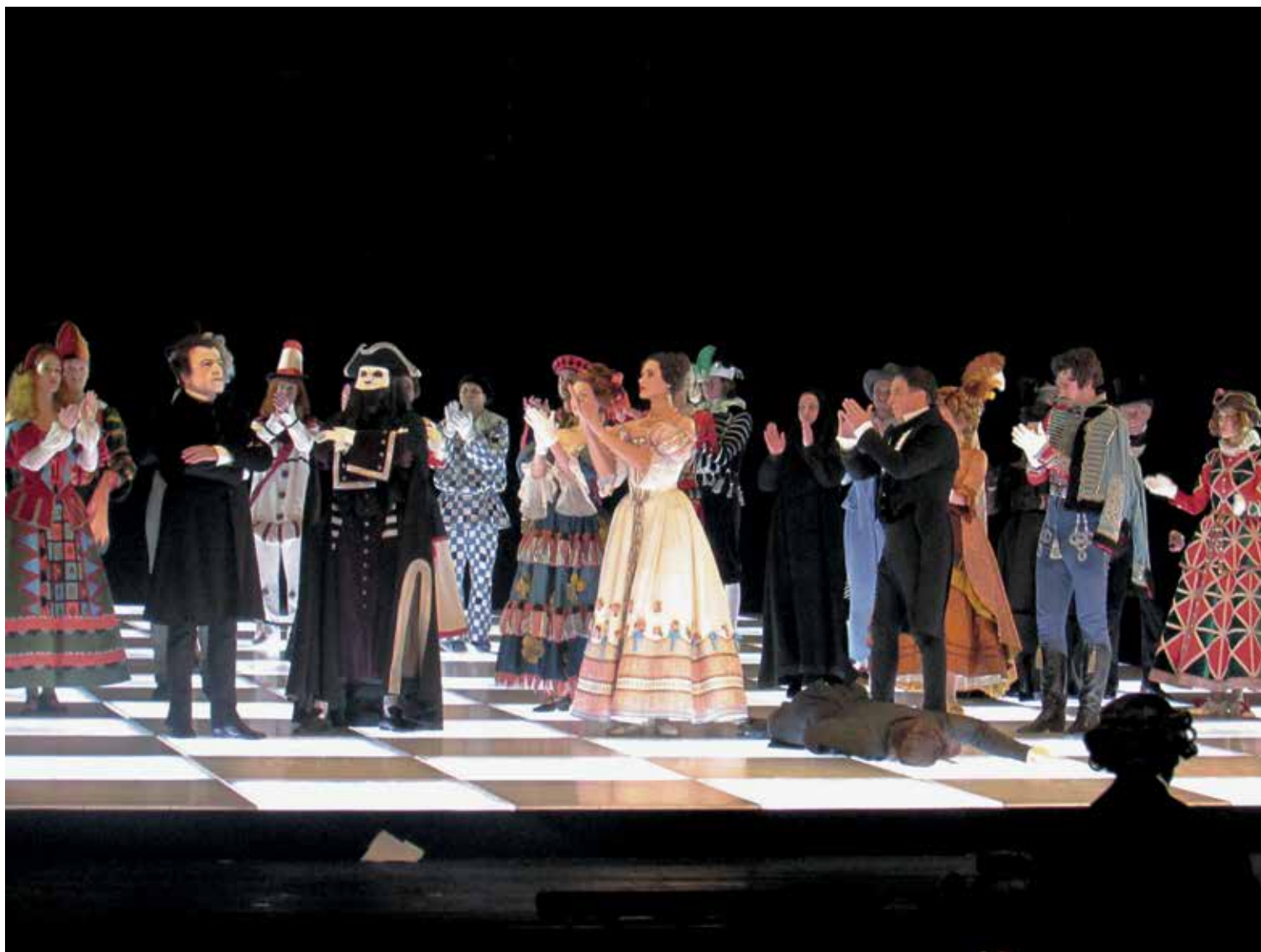
Mascarade, Souvenirs du futur , de Mikhaïl Lermontov, mise en scène par Valery Fokine, d'après la production de Vsevolod Meyerhold (1917), présentée lors de la 17 e remise du Prix Europe pour le théâtre, à Saint-Petersbourg, en novembre 2018.

Invité en novembre 2018, pour une deuxième année consécutive, à assister à cet événement d'importance mis sur pied il y a 31 ans par la Communauté européenne 1 , je revenais avec quelque appréhension dans l'ancienne cité des tsars, pourtant la « plus européenne des villes russes », a tenu à préciser le représentant culturel de l'endroit 2 , où j'avais vécu avec enthousiasme le Festival de la Maison balte en 2006 3 . C'est la Fondation de ce festival qui accueillait et finançait les activités entourant cette 17 e remise du Prix Europe pour le théâtre et des prix Réalités théâtrales qui y sont associés depuis 1991. Le durcissement de certaines politiques dans ce