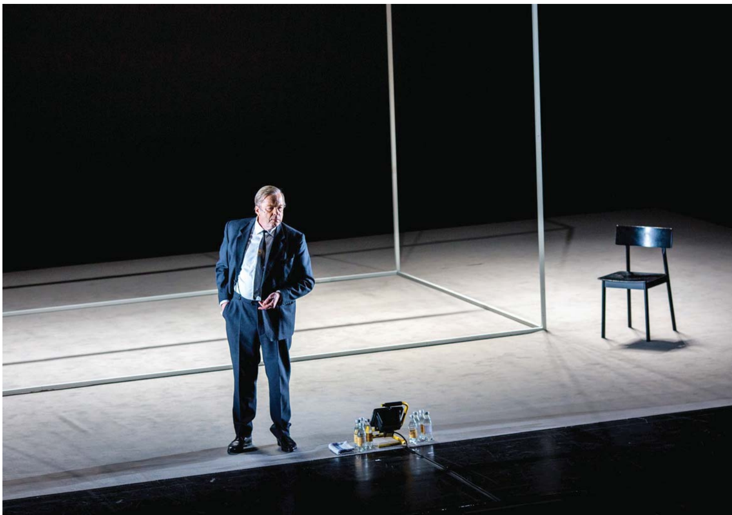
Doktor Glas , adaptation du roman de Hjalmar Söderberg, mis en scène par Peder Bjurman (Théâtre dramatique royal de Suède), présenté au Théâtre Maisonneuve de la Place des Arts en avril 2018. Sur la photo : Krister Henriksson.

aussi capitale culturelle d'un pays immense comme le Québec, et qui condense ses populations urbaines dans un rayon resserré. Stockholm, à l'image de Montréal, abrite une communauté artistique importante, qui s'active sur de multiples scènes pour nourrir une offre théâtrale foisonnante.