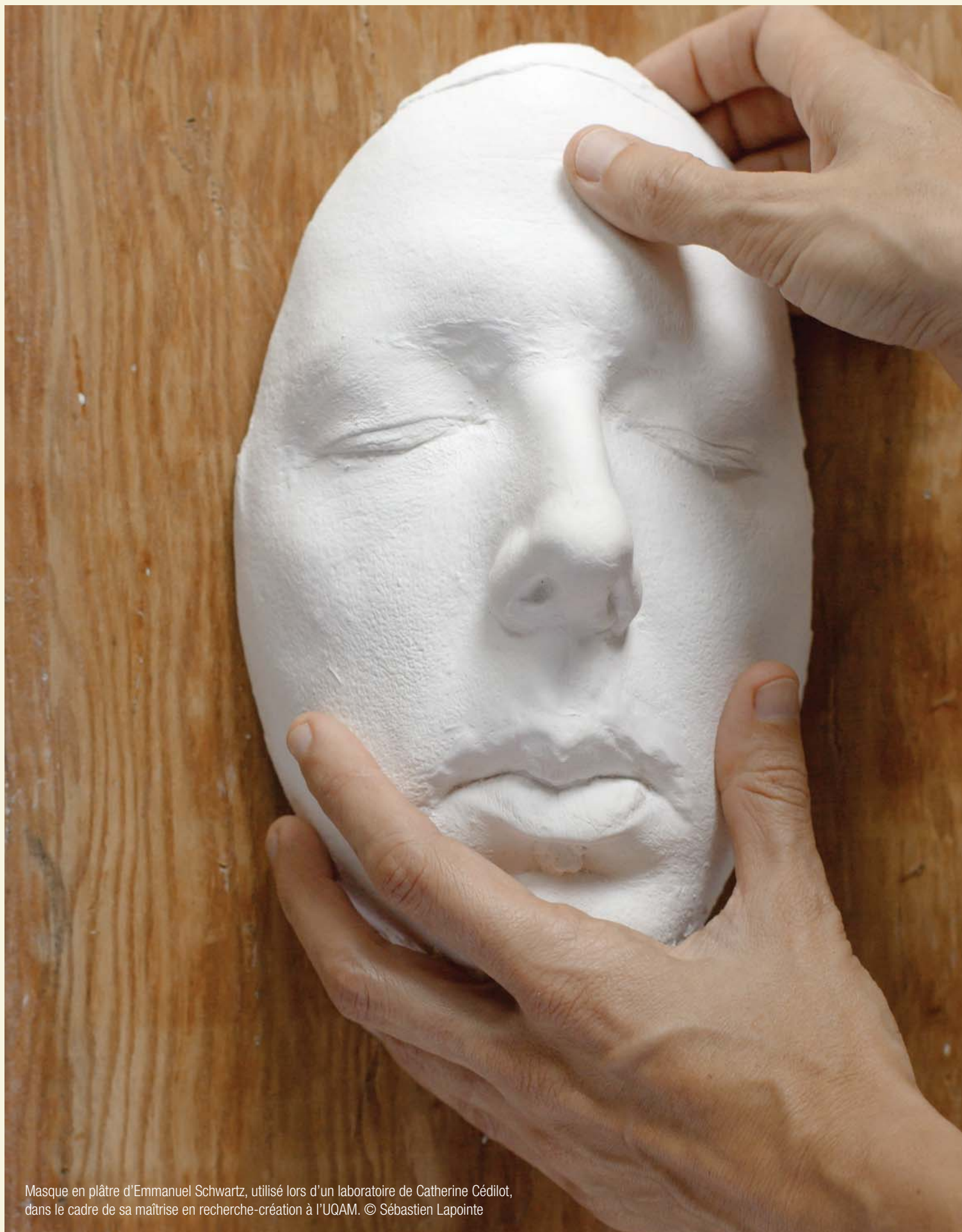
Masque en plâtre d'Emmanuel Schwartz, utilisé lors d'un laboratoire de Catherine Cédilot, dans le cadre de sa maîtrise en recherche-création à l'UQAM.