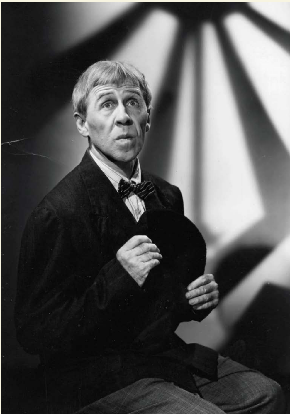
Gratien Gélinas dans le rôle-titre de Bousille et les justes (1959).

Fridolinou-le-sympathique-partisan-des-Canadiens ? Difficile de s'avouer que c'est mieux vu d'aller entendre du théâtre écrit par des gars (souvent des gars) de moins de 40 ans au regard ténébreux qui portent une à-peu-près-barbe, une casquette de trucker et un t-shirt avec une camionnette dessus !