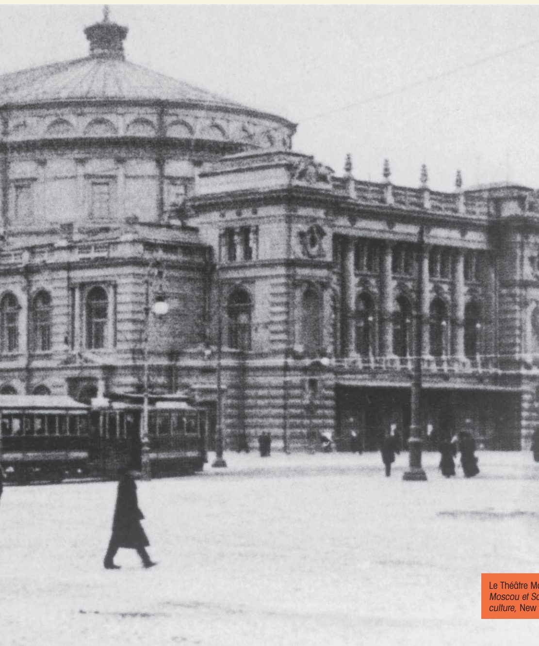
Le Théâtre Mariinsky, Saint-Pétersbourg.

Dernière affaire, j'ai pas une seule bonne idée pour sauver le Gauvreau, j'en ai 10! Là, on fait des raccords avec les finissants; les femmes, on réessaye les costumes, pis on enchaîne, tout le monde, à 13 h 30 tapant. À compter de lundi, on enchaîne pendant les 15 prochains soirs dans la Serge-Denoncourt avec l'équipe de techniciens au grand complet. On va être prêts comme jamais pour la grande première de L'Antichambre velue du diable le 22 décembre prochain. Ça va être le plus beau réveillon théâtral que le Québec aura jamais connu, vous pouvez me croire sur parole.»