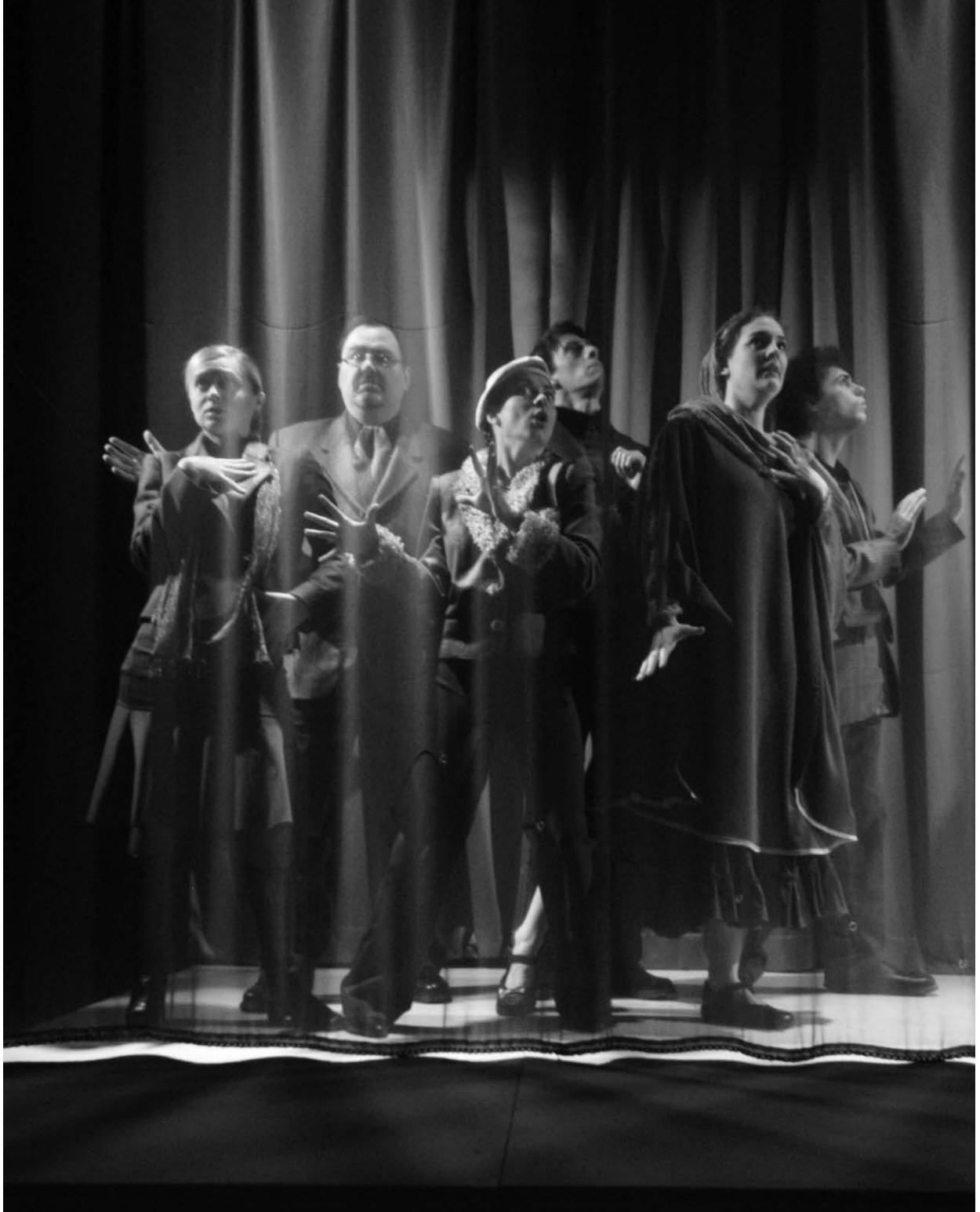
Exit(s) de Luc Moquin, mis en scène par Geneviève Pineault et Joël Beddows, coproduit, en 2006, par le Théâtre la Catapulte, le Théâtre du Nouvel-Ontario (Sudbury), le Conseil des Arts de Hearst, le Centre culturel la Clé d'la Baie (Pénétanguishene), le Centre communautaire de Chatham-Ken la Girouette (Chatham) et le Centre culturel Frontenac (Kingston). © Alexandre Mattar.