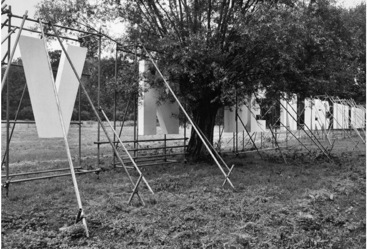
Installation de Jan Lauwers à Grimbergen (2002). La traduction en néerlandais du XI e siècle de « no beauty for me there where human life is rare » : « Verre van der menschen dinghen en vanc ic neghene schoenhede », avec des lettres manquantes.