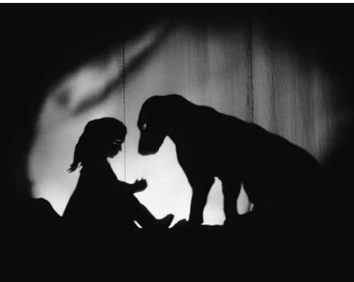
Chien Bleu , présenté par le Teatro Gioco Vita d'Italie au festival Petits bonheurs 2012.