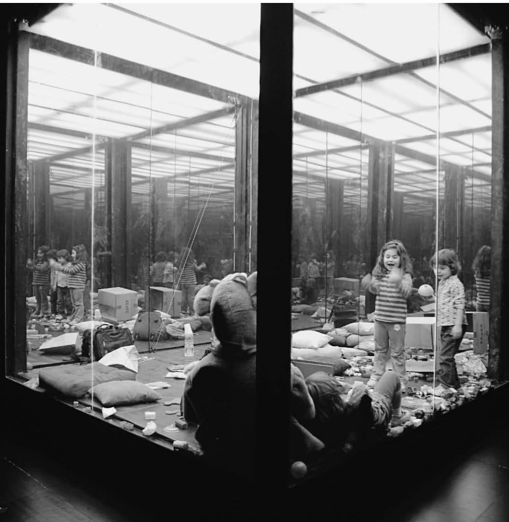
Inferno de Romeo Castellucci (Societas Raffaello Sanzio).

procédaient à une traversée de la scène manifestement chorégraphiée, donc préméditée, l'arrivée des enfants en très bas âge nous incitait à croire que ce à quoi nous assistions se dessinait spontanément. Dans une œuvre comme celle-là, il est vrai qu'à un moment donné notre position critique vis-à-vis de l'œuvre en cours laisse place à un étonnement. Que vont-ils faire ? Sont-ils conscients du jeu auquel ils prennent part ? Ou bêtement : est-ce que l'un d'eux va se mettre à pleurer ? C'est aussi le rapport au temps qui se trouve affecté. On se trouve moins dans le temps de l'œuvre, moins dans le temps vécu à travers les choix du metteur en scène, que dans le temps de l'enfant. On a soudain moins tendance à mettre en lien les actions les unes avec les autres pour se créer une cohérence ; on est plutôt absorbé dans le présent. On sait qu'à ce moment du spectacle, personne ne sait ce qui va se produire. On observe, amusé, comment une petite fille va réagir alors que son comparse vient d'envoyer au sol les craquelins qu'elle était en train de manger.